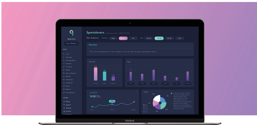
Furkan Şahin, Kimola Product Design, 2018